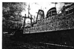
Kunst Raum Schiff STUBNITZ, Irrrealismus im Rostocker Stadthafen, 1993