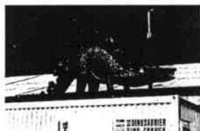
Dinosauriershow, Kaprealismus im Rostocker Stadthafen, 1993

Zentrale Anlaufstelle für Asylbewerber (ZAST) im Rostocker Stadtteil Lichtenhagen gekommen war, erfolgte in der Nacht vom 24. auf den 25. August '92 ein Brandanschlag - vor johlendem Mob - auf das sog. Vietnam-Haus, wo über hundert Vietnamesen nur durch glückliche Umstände dem Tod entkommen sind. Rostock rückte damit in die Reihe der Städte Hoyerswerda und Hünx, und wurde danach von Mölln und Solingen übertrifft. Im Dezember '92 erhielten die STUBNITZ-Initiatoren vom Kultusministerium Mecklenburg-Vorpommern eine finanzielle Unterstützung in der Höhe von DM 120.000,-; womit die Projektbasistförderung für die Adaption und den Erhalt des Schiffes gesichert werden konnte. -Auch Rostock - dann Heimathafen einer schwimmenden internationalen Künstlerwohnung - bekäme als Stadtname einen ganz anderen Klang als gerade jetzt-, steht in dem mit -Alter Fischdampfer wird Heimat für Künstler - beteiligten Artikel in der OZ (Ostsee-Zeitung) vom 7. Oktober '92.