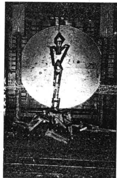
Auf der „Stubnitz“ wird gegenwärtig eine Metallskulpturen-Exposition gezeigt. E. R. Nele schuf auch den „Kettenmenschen“.