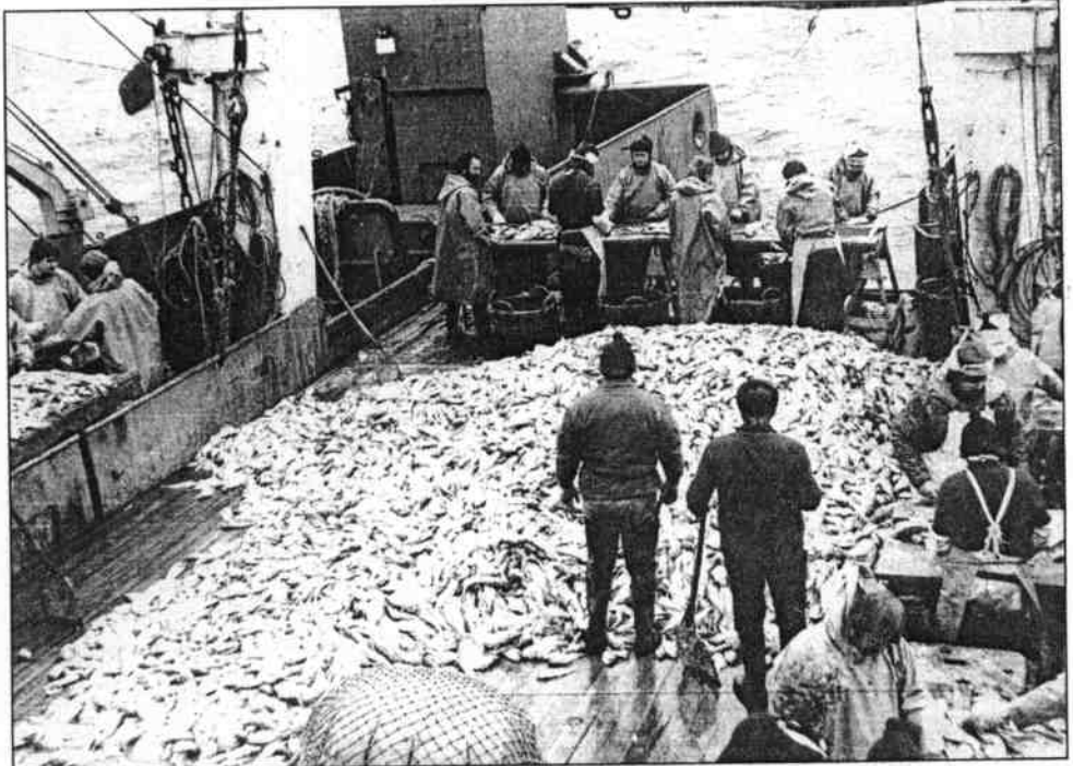
So sah es noch bis vor drei Jahren auf der „Stubnitz“ aus: Tonnen von Dorsch, Hering und Makrelen häuften sich an Deck. Die Fische wurden sofort unter Deck verarbeitet, tiefgekühlt und transportfertig gemacht.

Das Konzept der „Stubnitz“ sieht vor, Mannschaft und Verwaltung später von den Einnahmen aus der Miete für die Studios und Eintritt zu bezahlen. Grundidee ist der Austausch von Kunst und die Vernetzung von Medienwerkstätten in Hafenstädten im baltischen Raum. Zielgruppen, so Jost, sind Produzenten, Firmen, Hochschulen, Journalisten, Video- und Medienkünstler. eli