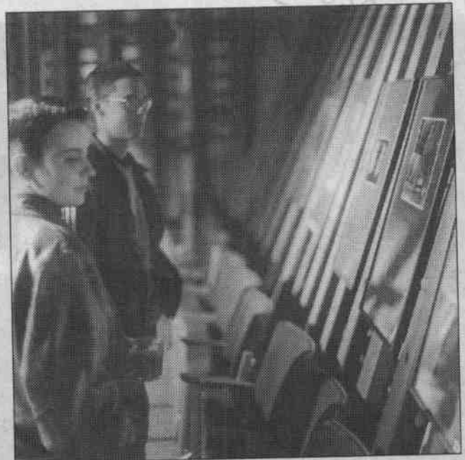
Die Ergebnisse des Workshops vom Verein Foto M-V sind jetzt an Bord der Stubnitz zu sehen.