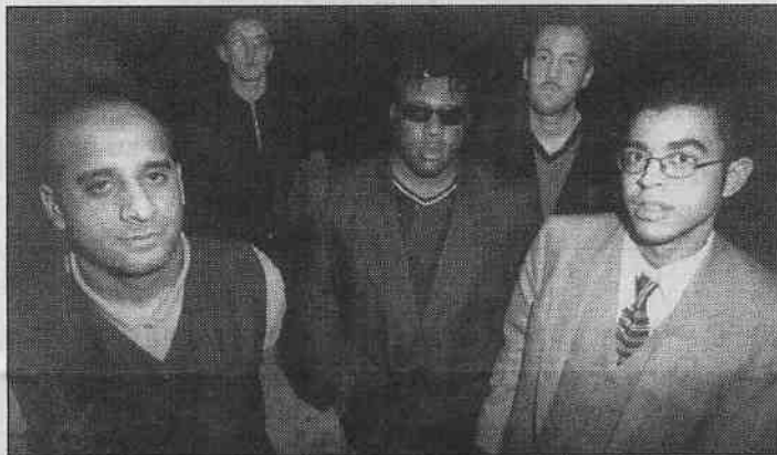
„Capone & The Bullets“ auf MS Stubnitz.

Rostock/RB. Ein temperamentvoller Einstieg ins Wochenende mit süßsouligem Ska Punk-Rocksteady und Reggae von den britischen Inseln erwartet die Stubnitz-Gäste Freitagabend, dem 16. Juli. Erst vor einem Jahr hat die gestandene, seit 1985 existierende schottische Ska-Band „Capone & The Bullets“ ihr Debüt-Album herausgebracht. Die CD heißt einfach „Capone & The Bullets“. Beginn ist gegen 21.00 Uhr. Tanzfiebertreibend dürften nach dem Auftritt der Ska-Band auch die Darbietungen von LS Diezel mit „Original Rockers Techno Dub“ sein sowie die DJ-Künste von Ken Tuby und Highly Unlikely (alle aus Großbritannien). Wer mag, kann dann Samstag gleich weitertanzen und feiern. Auf der Stubnitz heißt das Motto der Party dann „La Boom II“. Party auf zwei Decks mit den DJ's Anderz, Blocka, Max, Homie, Kaidar, Elek-Camino und Bernie. Live: Iguana u. a. Ca. 22.00 Uhr ist Beginn.