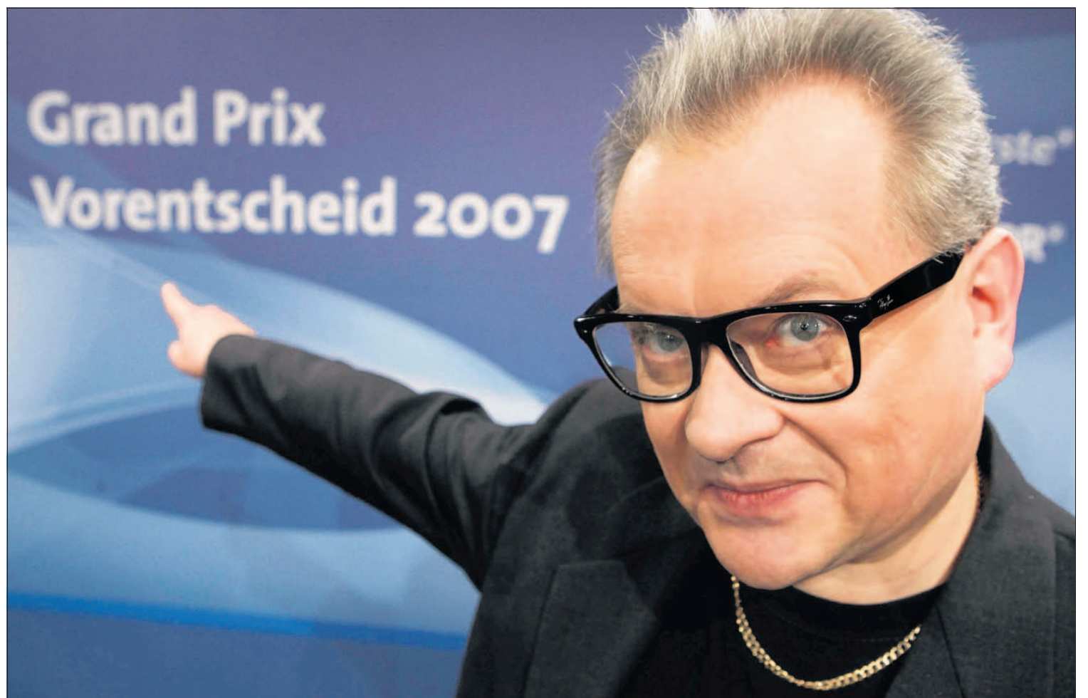
Der Sänger Heinz Rudolf Kunze (50) tritt mit seinem ironischen Song „Die Welt ist Pop“ beim Vorentscheid zum Grand Prix an.